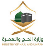
وزارة الحج والعمرة MINISTRY OF HAJJ AND UMRAH